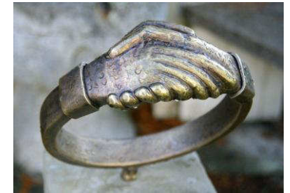
Der Vater hat den Ring bereit